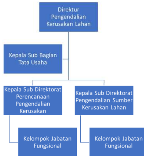
Gambar 1. Struktur Organisasi Direktorat Pengendalian Kerusakan Lahan

Untuk melaksanakan tugas dan fungsi Direktorat Pengendalian Kerusakan Lahan telah dibentuk unit organisasi sebagai berikut: