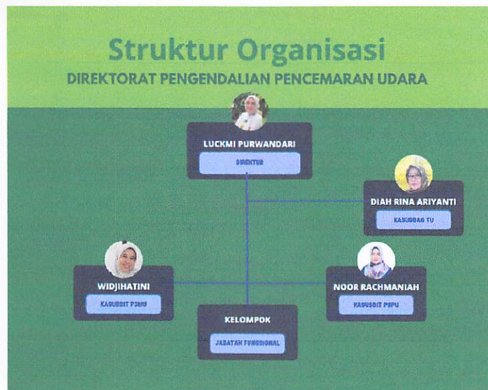
Gambar 1. Struktur Organisasi Direktorat PPU

Secara lengkap, struktur organisasi Direktorat PPU dapat dilihat pada Gambar berikut.